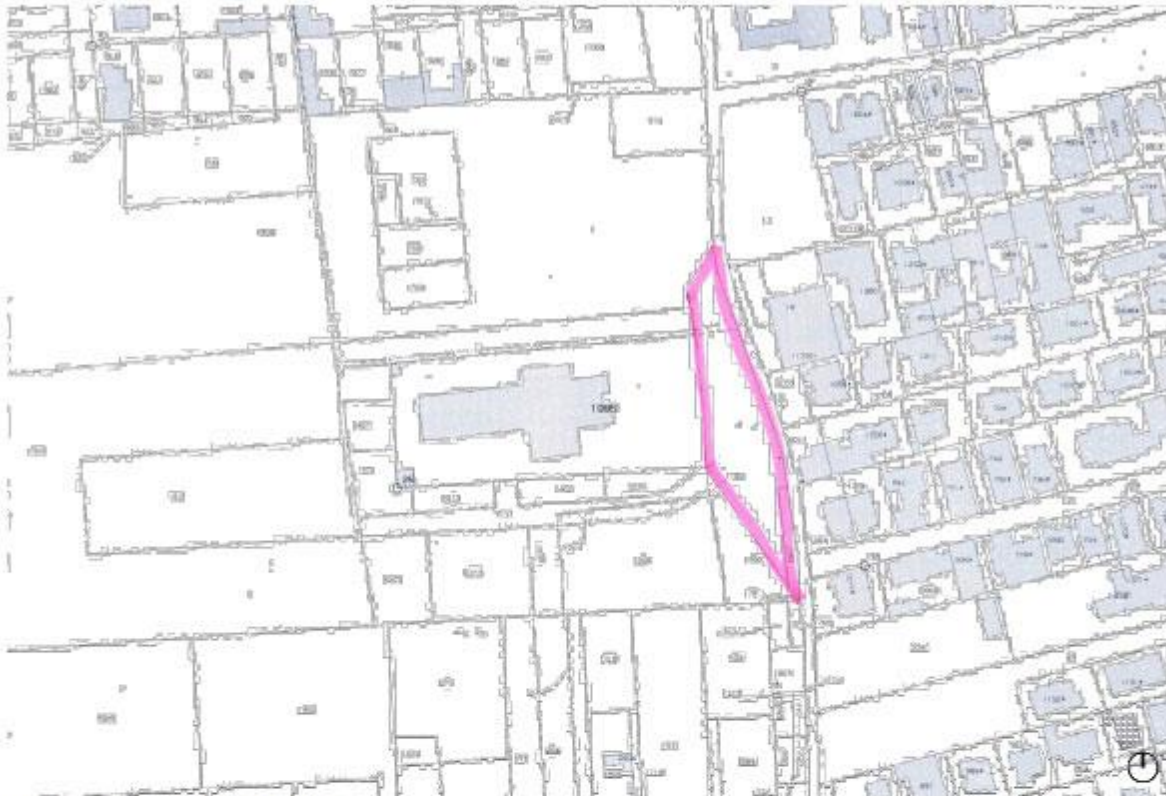
Stralcio planimetria catastale - foglio 4 part. 1199