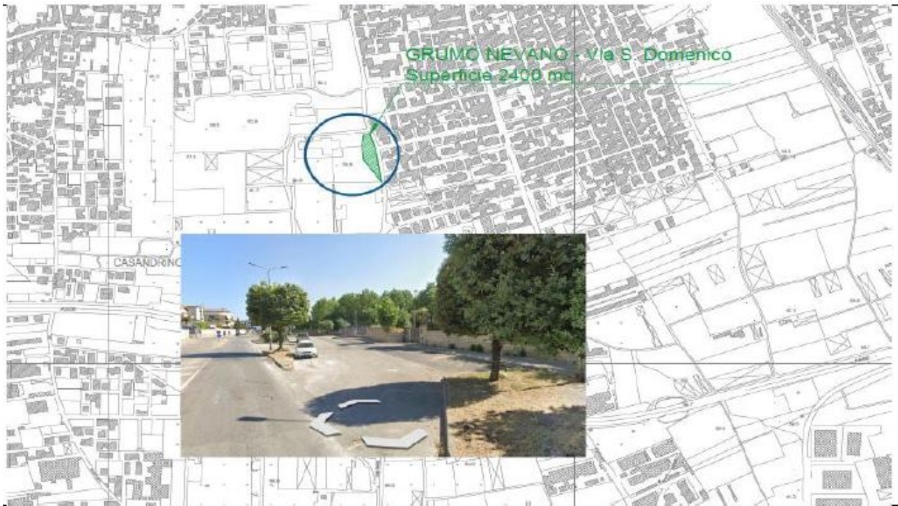
Figura 1. Collocazione territoriale area di intervento

Si riportano di seguito alcune foto aeree per l'individuazione dell'area oggetto dell'intervento.